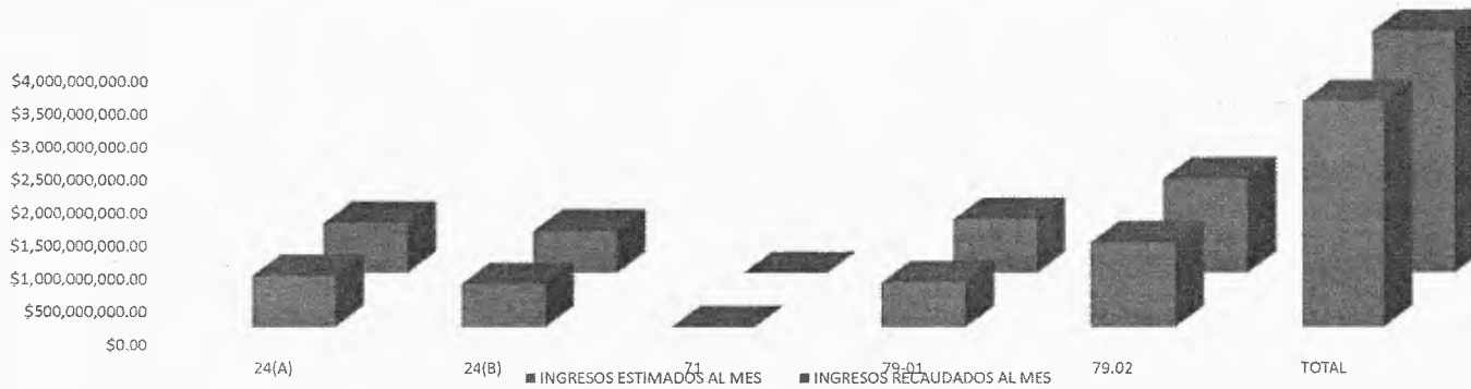
INGRESOS ESTIMADOS AL MES VS RECAUDADOS AL MES